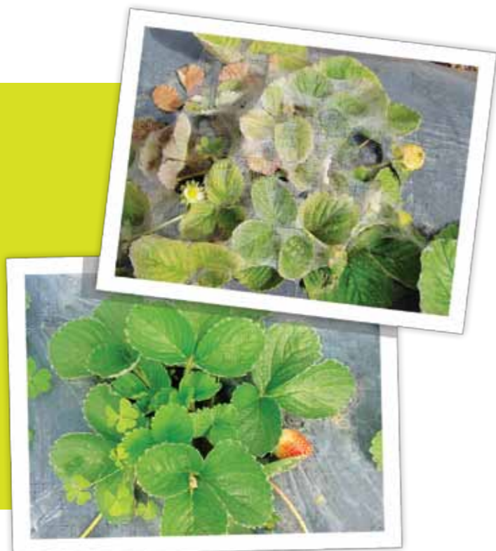
Sintoma de ataque de ácaro-rajado em morangueiro

O ácaro-rajado, Tetranychus urticae , é considerado um dos ácaros-praga de maior importância econômica, causando consideráveis prejuízos em diversas culturas, como algodão, feijão, mamão, morango, pêsego, soja, tomate e ornamentais.